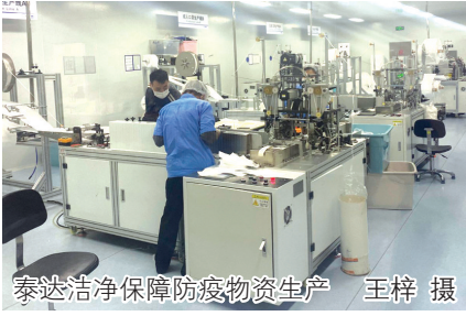
泰达洁净保障防疫物资生产

保企业用工,打通生产企业原料供应堵点,保产业链供应链“不断线”……随着本轮疫情实现社会面清零,滨海新区按照天津市相关要求,在毫不松懈抓好疫情防控的同时,多措并举,有序做好企业的复工复产。