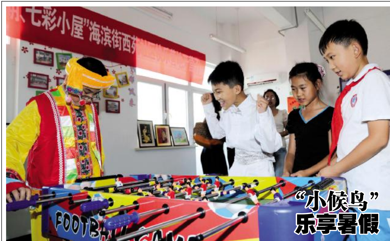
近日,海滨街、吉林街、大港街等多个街道社区暑期快乐营地陆续开营,目前已接纳总共150多名小朋友参与活动。据了解,暑期快乐营地安排了丰富的活动内容,3D手工制作、舞蹈、文明楼门绘画制作、观看核心价值观动画片等,让假期里的孩子们“寓教于文,寓教于乐,寓教于活动”,让更多的小候鸟融入新区大家庭。 文/记者 张爱萌 图/记者 贾成龙